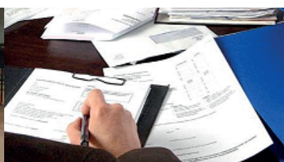
Winnende vacatures voor organisaties – 24 februari

Scholingsbijeenkomsten digitaal terugkijken? Dat kan via www.x-talk.nl