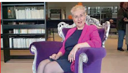
Voeding & leefstijl proteïnen – 14 okt