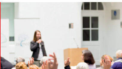
Pitchen – 13 jan