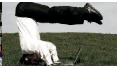
Meditatie – 27 jan