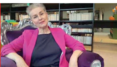
Voeding & Leefstijl: Leaky Gut – 3 februari