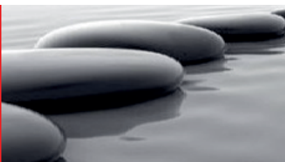
Mindfulness cursus (8x) – 25 okt