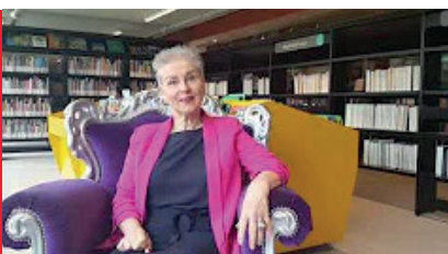
Voeding & leefstijl: De supermarkt- leugen – 25 november