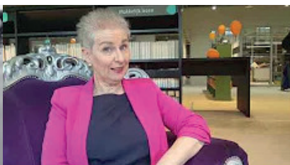
Voeding & leefstijl: water – 28 okt