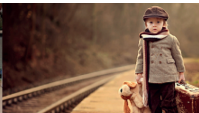
Een kennismaking met hoogbe- gaafdheid – 21 okt