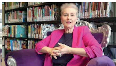
Voeding & Leefstijl: Personal Program – 6 januari