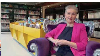
Voeding & Leefstijl: Chemicals & Heavy Metals – 20 januari