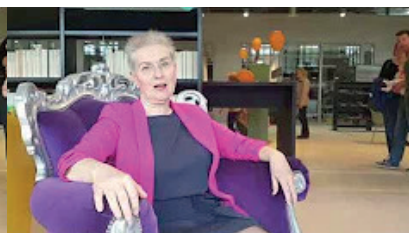
Voeding & Leefstijl: emoties en gedachten – 11 nov