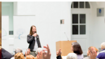
Assertiviteitstraining (8x) – 23 okt